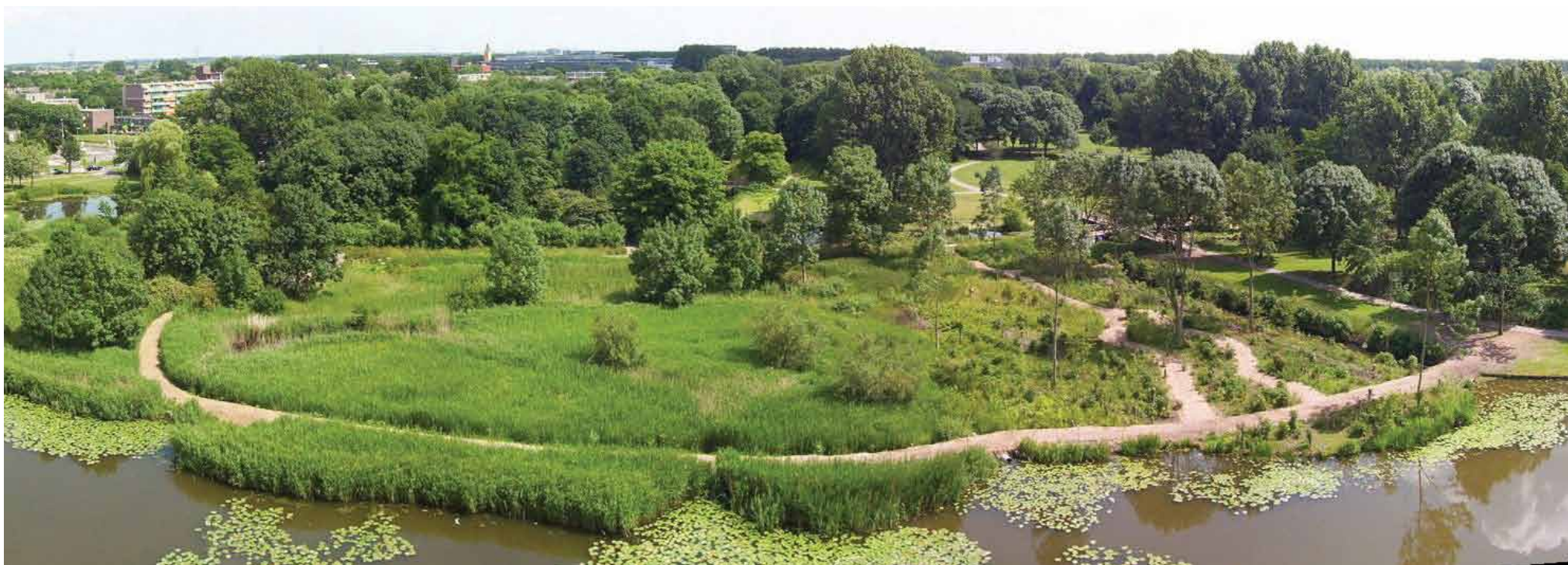
foto huidige situatie, het open karakter van het gebied is nog steeds aanwezig

planburo infra groen adviseurs voor de buitenruimte www.infragroen.nl 010-4506041