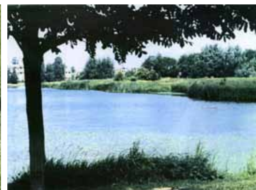
foto's na aanleg, waterberging en natuurontwikkeling ende kruisbrug met bestaande grote wilg