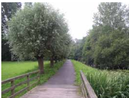
foto huidige situatie, Munnikenweggetje